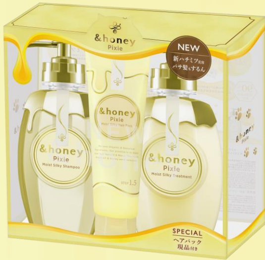
限定トリプルセット

初回限定トリプルセットを購入された方限定で、9月27日(水)～11月30日(木)まで、猫シールキャンペーンを開催いたします。当選者には、限定スペシャルセットをプレゼント。