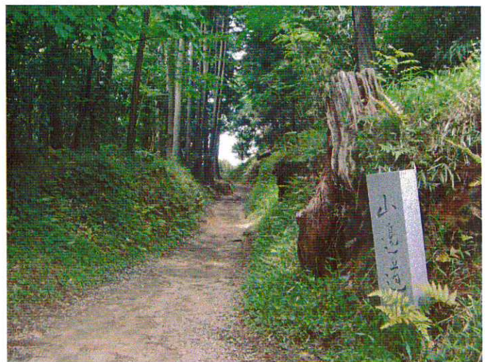
山の辺の道

今後もこのプランを通じて、奈良県と共に“記紀・万葉プロジェクト”の告知を行い、多くの新規観光客を誘致できればと考えています。