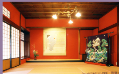
※掲載写真はイメージです。