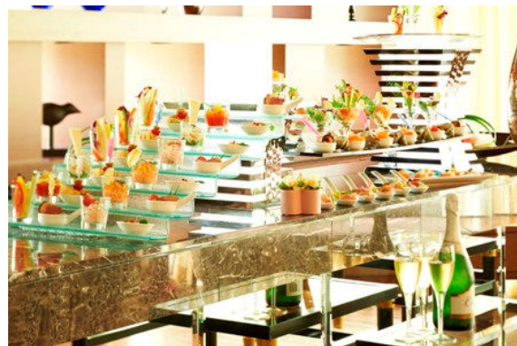
ウエルカムパーティー料理 イメージ