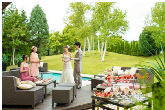
ボーナス特典 B デザートbuffet

ご予約・お問い合わせ TEL:0476-32-1144(ウエディング係 10:00~18:00) ホテル日航成田ホームページ http://www.nikko-narita.com/