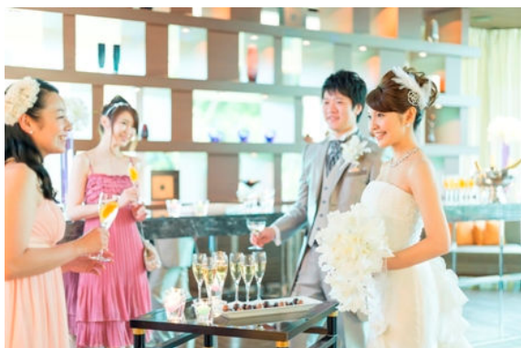
ウエルカムパーティー演出