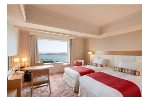
ベイビューフロア