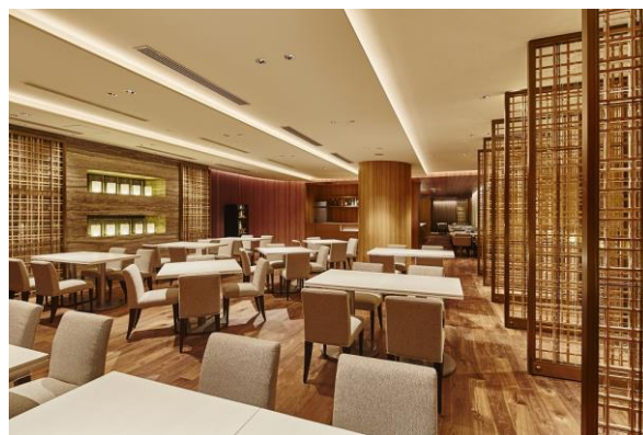
レストラン All Day Dining 紗灯

https://hotelnikko-tachikawatokyo.jp/restaurant/