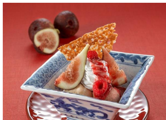
『クープグラッセ ガランス』ご提供イメージ

本プラン以外にも、食材の宝庫「淡路島」の旬の美味を贅沢に組み合わせた会席料理、または地中海フレンチのコース料理に、2周年記念で誕生した「ピエール・エルメ・パリ」とのコラボレーション『クープグラッセ ガランス』をデザートとしてご提供する10月限定のプランや、8階以上の高層階「プレシヤスフロア」でのご宿泊と2周年にちなんだ2特典付きプランなど、多彩な宿泊プランをご用意しております。