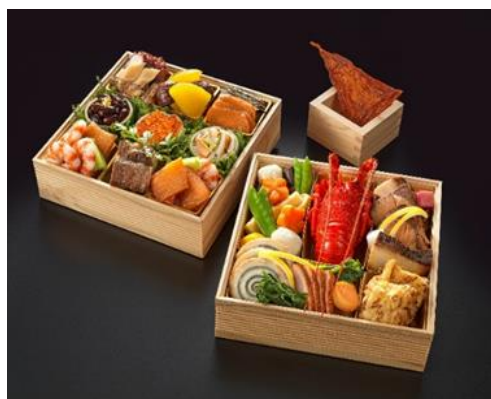
「特撰 夢おせち」和風二段重