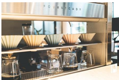
バリスタの動きをプログラミングした コーヒードリップ機器 「POURSTEADY」