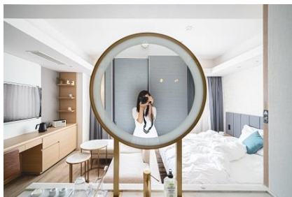
客室 (2F~14F: 全 191 室)