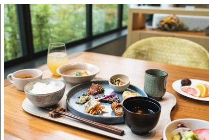
朝食イメージ (和食ご膳) *この他にも洋風メインプレート (3種類) あり

今回の再選出に際し、当ホテル総支配人の西 邦之は「これまでニッコースタイル名古屋をご利用くださった全てのお客様に、まずは心からの感謝を申し上げます。コロナ禍の真ただ中でオープンした開業 3 年弱のホテルでありながら、非常に多くのご支援をいただき、スタッフ一同大変光栄かつ誇りに思っております。願わくはご旅行の目的にしていだけるようなホテルを目指し、音楽やコーヒーをはじめ皆様の心身がやすらぐ場所であることに加え、更なる価値創造をして参る所存です」とコメントしています。