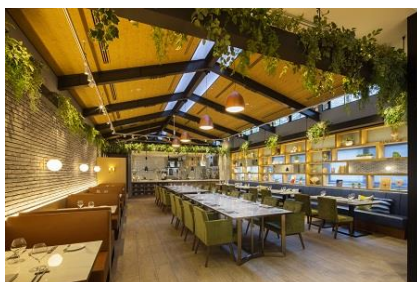
レストラン「style kitchen」 (スタイルキッチン、1F)