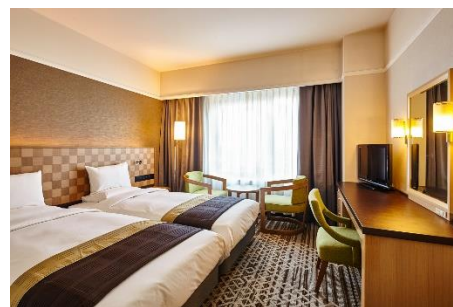
ハリウッドツインルーム