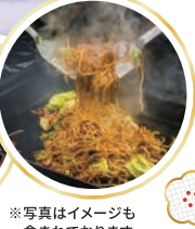
※写真はイメージも含まれております