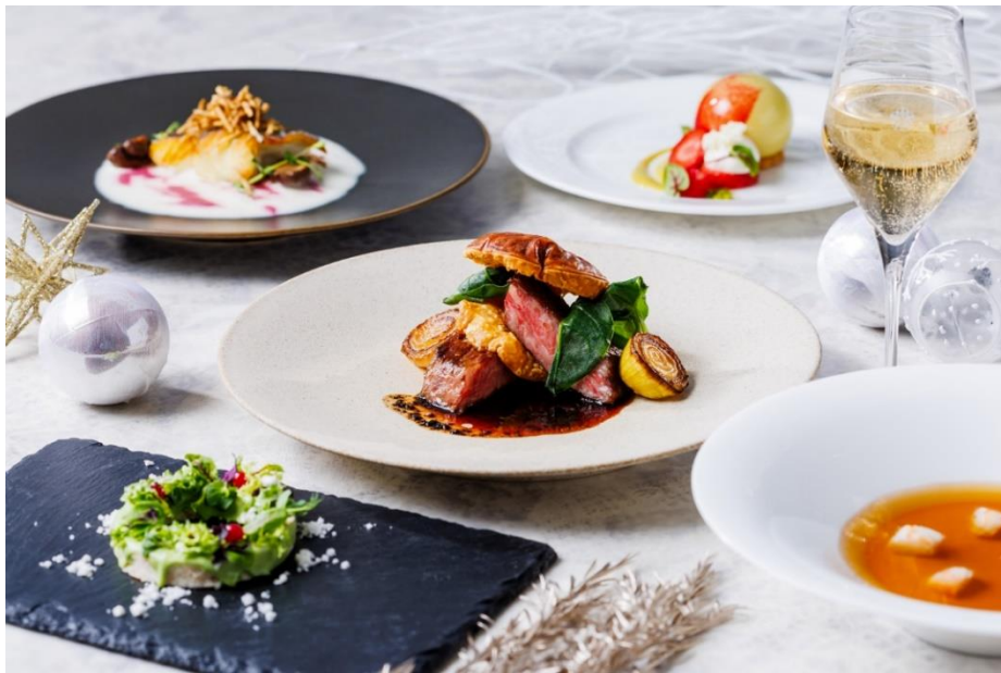
周年記念 クリスマスディナーコース

ホテル日航立川 東京（東京都立川市／総支配人 青柳亮司）のレストラン「All Day Dining 紗灯」（1階）では、ホテル開業8周年を記念した「周年記念特別メニュー」を2023年10月～12月に提供しており、12月16日（土）～12月25日（月）の期間中は、クリスマスイメージした華やかなコースメニューが10日間限定で登場します。