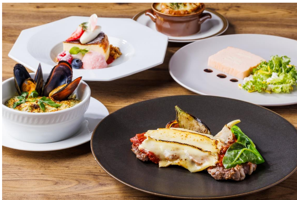
プリフィックスランチセットイメージ（写真の組み合わせで6,300円）

前菜・スープ・パスタ・メイン・デザートそれぞれをお好きな組み合わせで楽しめる「プリフィックスランチセット」にもチーズフェア限定のアップグレードメニューを取り揃えました。