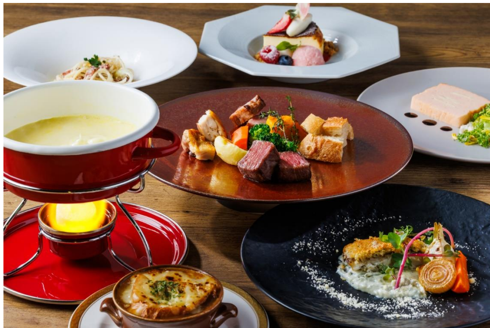
チーズ満喫コース

ホテル日航立川 東京（東京都立川市／総支配人 青柳亮司）のレストラン「All Day Dining 紗灯」では、2024年1月4日（木）から2月29日（木）まで『あったかチーズフェア』を開催します。チーズづくしのコースや、限定アップグレードメニューが楽しめるプリフィックスランチセットなど、寒さが厳しくなる季節に身も心もあたたまるチーズメニューをご提供します。