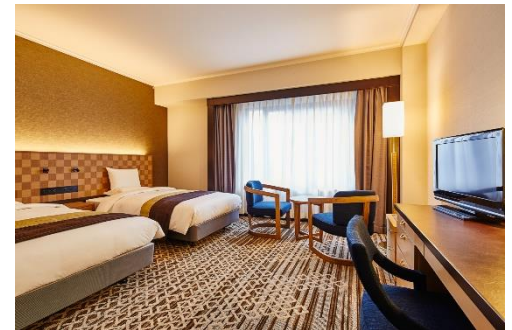
モデレートツインルーム