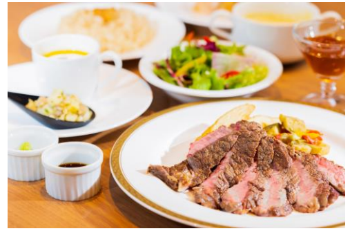
食べ放題メニューイメージ

<お電話> 042-503-9100 レストラン「All Day Dining 紗灯」(7:00～21:00)