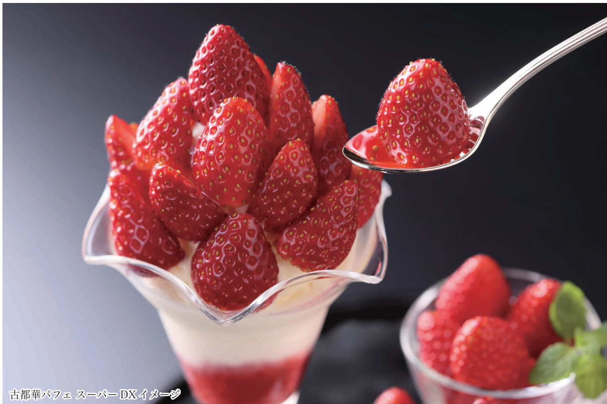
古都華パフェ スーパーDX イメージ

今回のフェアでも土耕栽培や有機肥料にこだわる奈良県天理市の“中井農園”で収穫されたいちごのみを使用。奈良県オリジナル3品種「古都華」「ならあかり」「アスカルビー」を使い、シンプルな「古都華パフェ」、いちごを20個以上使った「古都華パフェ いちごDX」、さらにいちごを増量した「古都華パフェ スーパーDX」をご用意します。産地ならではの鮮度の高さと艶やかな一粒一粒をお楽しみください。