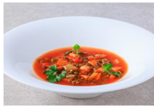
春野菜とレンズ豆の ミネストローネ