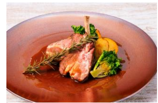
仔羊のロースト ローズマリー香るジュ