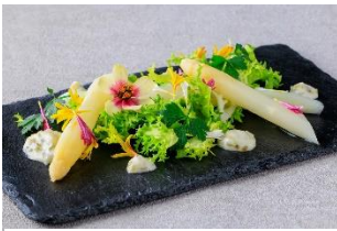
ホワイトアスパラガスの サラダ仕立て スイートレリッシュソース