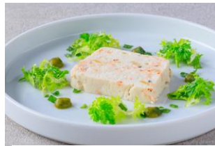
アサリと桜海老のテリーヌ 大葉香るビネグレットと共に