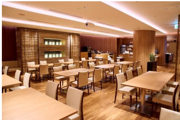
レストラン All Day Dining 紗灯

https://hotelnikko-tachikawatokyo.jp/restaurant/