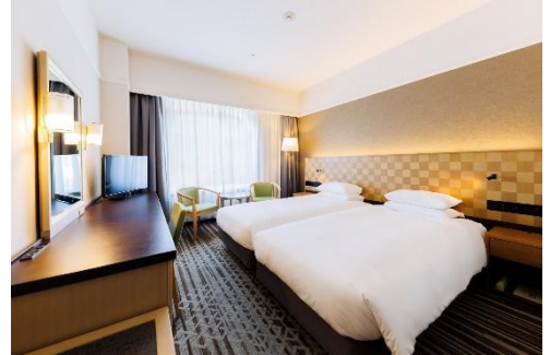
ハリウッドツイン