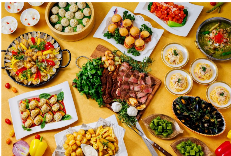
ゴールデンウィーク ステーキ食べ放題と世界のグルメbuffet

ホテル日航立川 東京（東京都立川市／総支配人 伊藤寿章）のレストラン「All Day Dining 紗灯」（1階）では2026年4月24日（金）から5月6日（水・休）までの13日間限定で、「ゴールデンウィーク ステーキ食べ放題と世界のグルメbuffet」を開催いたします。また、同期間、夕食に本buffetが付いた2食付き宿泊プランを販売します。