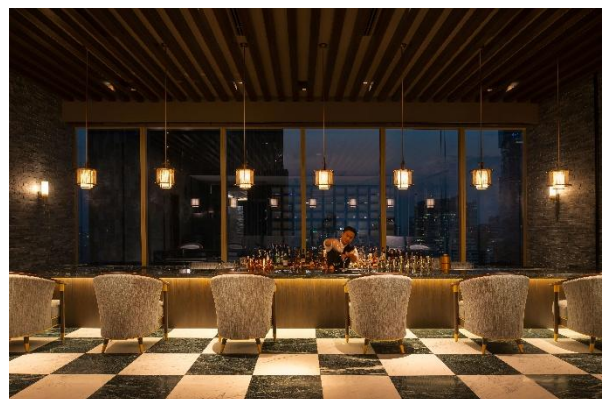
ルーフトップバー「TENKU 33」