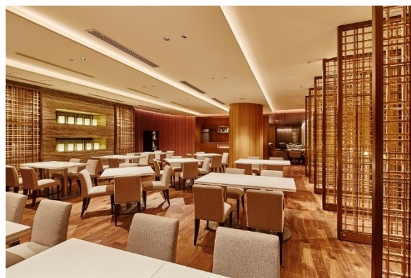
レストラン All Day Dining 紗灯