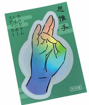
仏さまの印相「思惟手(しゆいしゅ)」の ホログラムレインボーステッカー