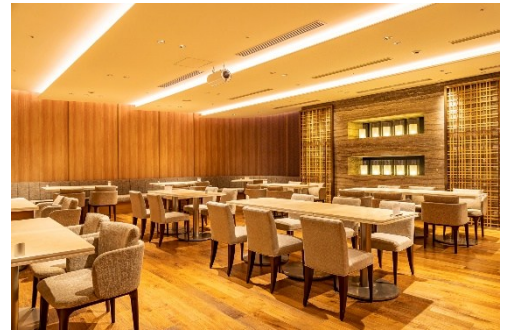
レストラン All Day Dining 紗灯

https://hotelnikko-tachikawatokyo.jp/restaurant/