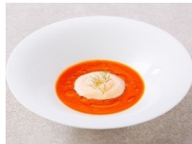
海老香るトマトスープ