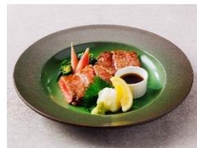
牛サーロインの和風ステーキと茗荷の甘酢漬