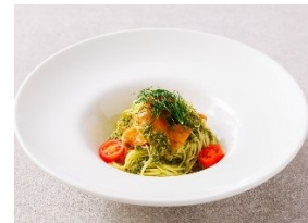
スモークサーモンとバジルの冷製カッペリーニ