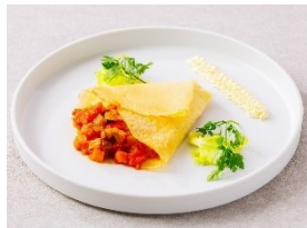
ラタトゥイユのクレープ包み クリームチーズ添え