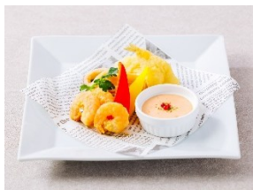
キス・エビ・イカのセモリナ粉のフリット オーロラソース