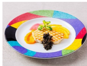
カジキのグリル タブナードソースとオレンジ香るカボチャのピューレ