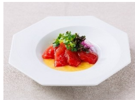
マグロカルパッチョ 新芽サラダ仕立て