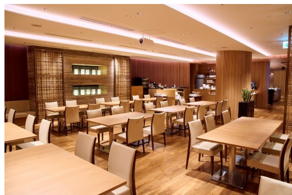
レストラン All Day Dining 紗灯

https://hotelnikko-tachikawatokyo.jp/restaurant/