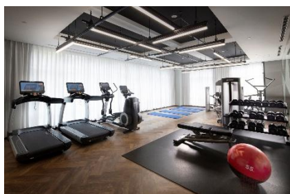
フィットネスジム