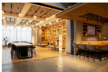
コミュニアルロビー (左) DJ ブース (右)