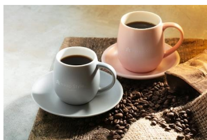
「TRUNK COFFEE」 ホテルオリジナルブレンドコーヒー