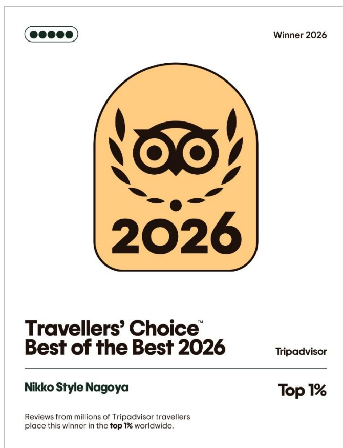
「2026 トラベラーズチョイス ベスト・オブ・ザ・ベスト ホテル」サーティフィケート