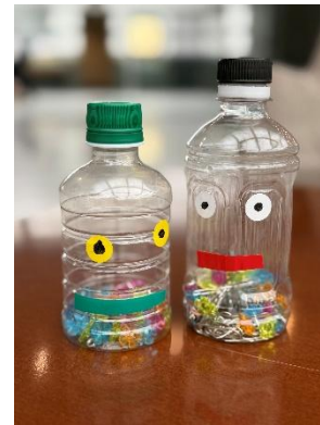
手作りマラカスのイメージ

公式サイト: https://www.nikko-tsukuba.com/event/event10