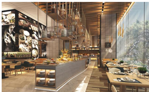
<オールデイダイニング「オアシス」内観>

館内には 4 つの料飲施設があり、日本料理「飛翔」、オールデイダイニング「オアシス」、ロビーラウンジ「カーブ 55」、そしてプールバーを用意しております。ご朝食は、タイ料理をはじめとするインターナショナルな朝食をbuffetスタイルで提供するオールデイダイニング「オアシス」、または日本料理「飛翔」にて、和食料理長が腕をふるい取り揃える、種類豊富な和食buffetよりお選びいただけます。