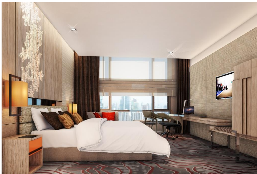
<ゲストルーム イメージ図>

当ホテルは、バンコクにおける初のニッコー・ホテルズ・インターナショナルのホテルとなり、このたびの開業に際して特別料金をご用意しております。