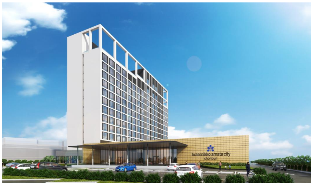
【『ホテル・ニッコー・アマタシティ チョンブリ』 パース画像】