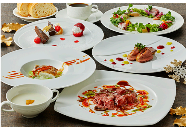
スカイバンケット「クリスマスディナーコース」

ホテル中庭に広がるLED電球5万球超えのイルミネーションを見渡せるレストラン、カジュアル・リゾート・ダイニング「セリーナ」では、同期間「クリスマスディナーバイキング」を開催いたします。シェフが目の前でカットする「アンガス牛のローストビーフ」や濃厚な味わいの「トゲズワイ蟹」、デザートコーナーには「ロングブッシュ・ド・ノエル」やドイツのクリスマスに欠かせない「シュトーレン」など、この時期しか味わえない料理をすべて食べ放題でご用意。加えて12月22日(土)から24日(月)の3日間は、ライブ演奏やサンタクロースのグリーティング、お子様にはバルーンやプチギフトのプレゼントがございます。