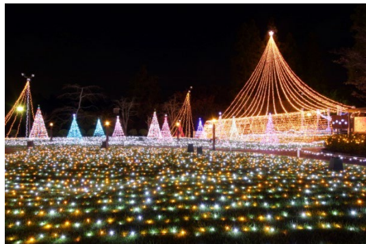
ホテル中庭に広がる ウインターイルミネーション

とちおとめと北海道産クリームのショートケーキ/ブッシュ・ド・ノエル/ズコット/シユトーレン/ケーキ各種/フルーツ各種/ソフトクリーム など