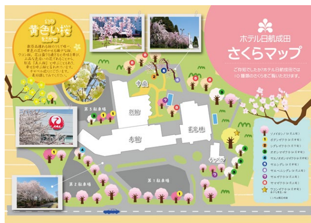
敷地内の散策用「さくらマップ」もご用意