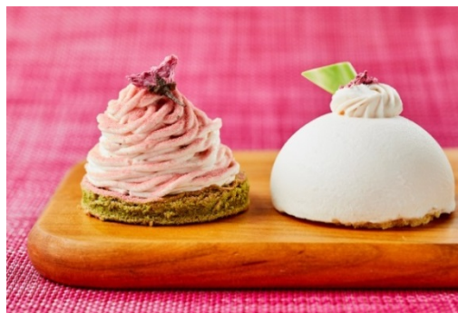
左「さくらモンブラン」、右「さくらムース」