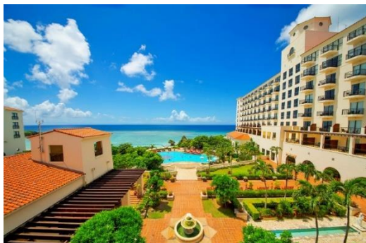
[View1 スーペリアオーシャンパティオ]

[View7 レンタサイクル] 沖縄ならではのサトウキビ畑の仲をのんびりサイクリング