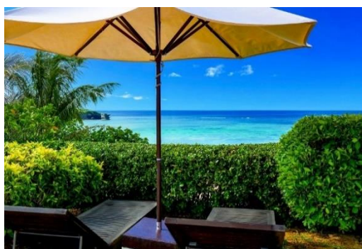
[View6 専用パラソル&デッキチェア]