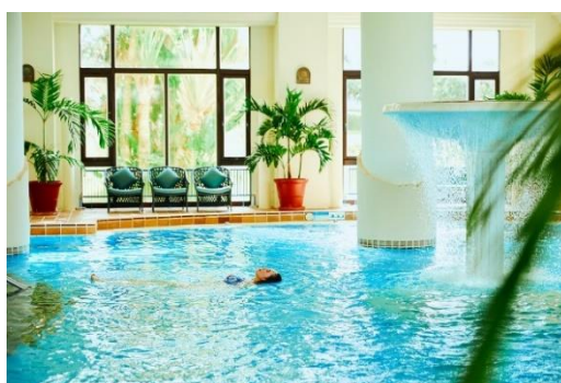
[View4 リラクゼーションプール]