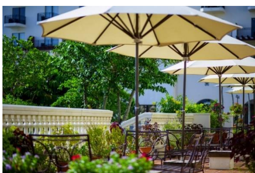
[View5 ラウンジ「アリアカラ」]