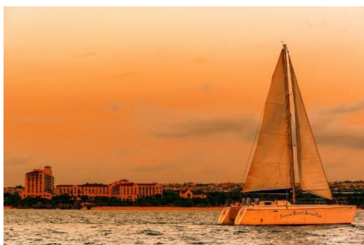
[View3 カタマランヨット「キラ」]