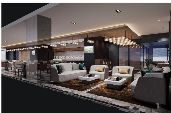
<ニッコーラウンジ>

さらに、全てのご宿泊のお客様は、最上階のプール・フィットネス・大浴場、1 階のビジネスコーナー・コインランドリーを無料でご利用いただけます。