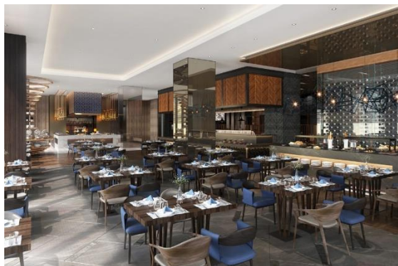
<四季彩／インターナショナルエリア>