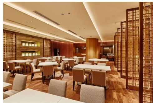
レストラン All Day Dining 紗灯

https://hotelnikko-tachikawatokyo.jp/restaurant/