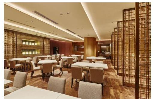
レストラン All Day Dining 紗灯

https://hotelnikko-tachikawatokyo.jp/restaurant/