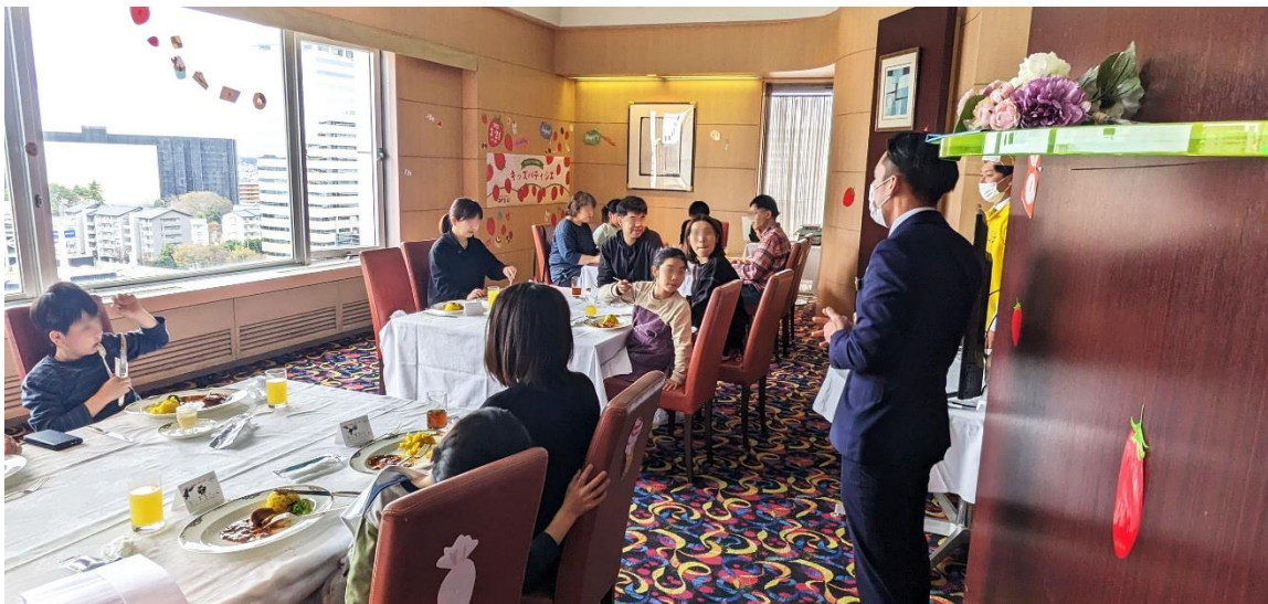
第2回の開催風景(2023年3月21日)

本プロジェクトの第3弾として、市内のブルーベリー農園「クイーンズブルーベリーガーデン」とコラボレーションした親子料理教室『ホテルシェフに学ぶ料理体験！』を2023年7月8日(土)に開催します。