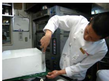
土台に下地クリームを塗る作 業からスタートしました。