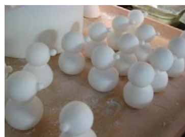
スノーマン大量製造中です。