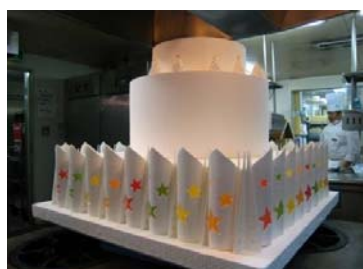
下段の装飾ができてつありま す。ロケットのような…