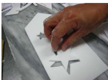
薄く伸ばした生地から☆を1 つ1つ型抜き作業です。