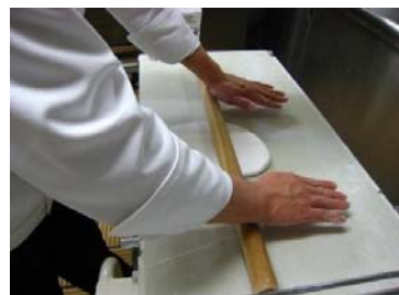
おっ！手打ちうどん？実は粉 糖の生地を伸ばす作業です。