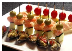
ワインと一緒に！「ピンチョス」