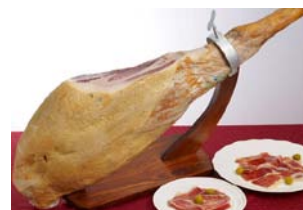
オプション「ハモン イベリコ」