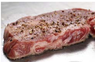
スペイン極上黒豚「イベリコ豚」