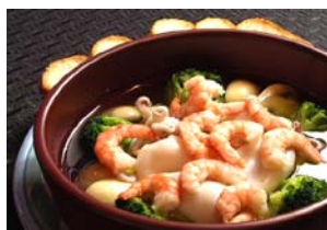
代表的なタパス「アヒージョ」