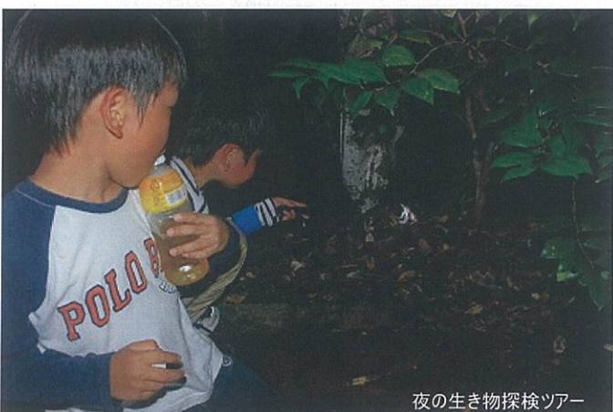
夜の生き物探検ツアー