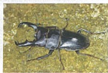
オキナワヒラタクワガタ