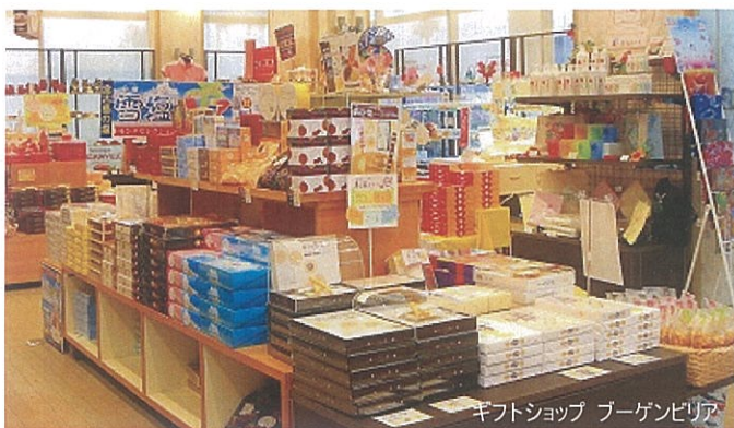
ギフトショップ ブーゲンビリア