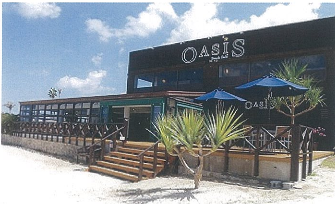
Beach café OASIS

既に当ホテルホームページでは、潤初時期にオススメするホテルの過ごし方や宿泊プランなども先行販売しております。