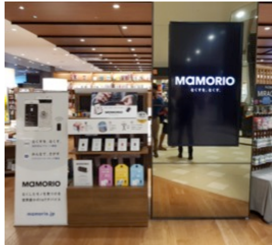
MAMORIO 展示展開イメージ