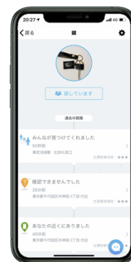
△位置情報通知イメージ

※一般のお問い合わせ先表示は、東武鉄道お客さまセンター TEL03-5962-0102