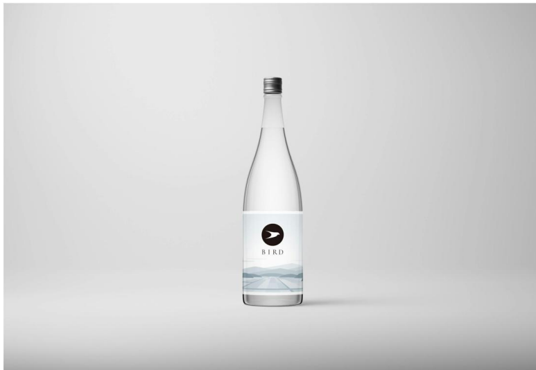
副業者3名が支援した「株式会社中沖酒造店」の日本酒の新ブランド「BIRD」

パーソルキャリア株式会社の副業・フリーランス人材 マatchingプラットフォームサービス「HiPro Direct」は、山形県から受託した「やまがた未来（みら）くる人材活用事業」の超実践型ワークステイプログラム「“山形×酒蔵” いいもの発掘プロデュース」でマッチングに至った副業・兼業人材3名による支援で、クラウドファンディングでの資金調達の600%達成を実現したことをお知らせいたします。