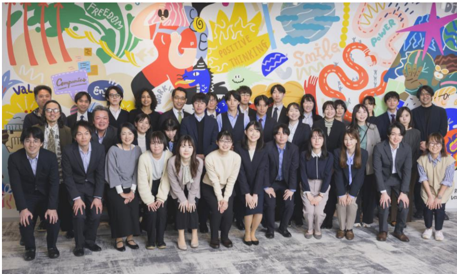
公務ブランディングワークショップ参加者（人事院・内閣人事局・各府省職員）

この取り組みは、公務の価値を自らの言葉で捉え直し、新卒層を含む若手世代に向けて“伝わる形”へと翻訳する力の強化を目的としたものです。研修には、採用ターゲット層の一つである大学生も参加し、新卒採用広報の改善にも資する取り組みとなりました。