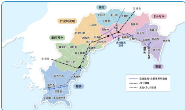
県内6エリアの特徴から住む場所、住まいの探し方、家賃の目安を提示

生活環境やエリア特性に加え、はたらき方に関するデータも含めて整理し、暮らしと仕事の具体像をイメージできるコンテンツです。