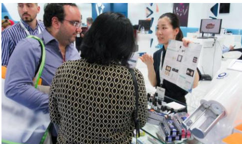
海外との取引や出張を行いながら、高知に拠点を置いてはたらくキャリア事例

さまざまなバックグラウンドを持つ方の実体験から、はたらき方や暮らしの多様な選択肢を具体的にイメージできるインタビュー記事です。