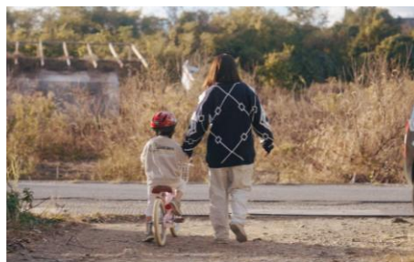
高知にUターンし、子育てに理解ある会社でリノベーションの現場監督と子育てを両立する事例