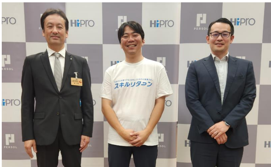
トークセッションの様子

特設サイト： https://hipro-job.jp/skilljunkan/skillreturn/yamagata/