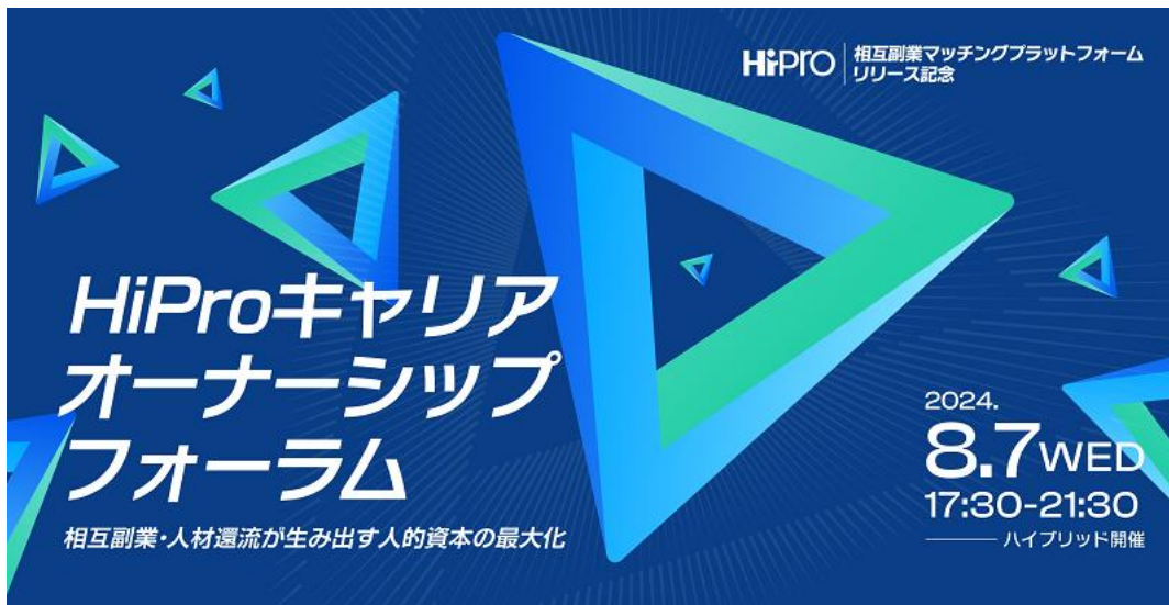
※「相互副業マッチングプラットフォーム」の利用開始は2024年10月を予定

企業参加申込ページ： https://direct.hipro-job.jp/event/hipro-careerownership-forum