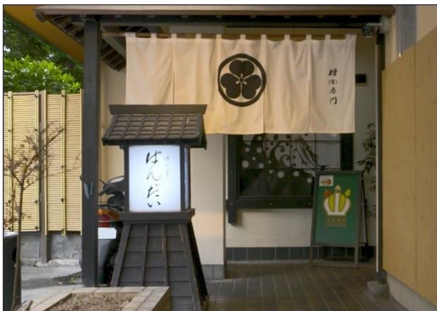
株式会社金萬が展開する「味の里 ばんだい」

スキルリターン山形 特設サイト： https://hipro-job.jp/skilljuncan/skillreturn/yamagata/