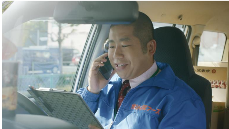
「DODA それぞれの転職 #003 澤部佑篇」

総合人材サービス、パーソルグループのパーソルキャリア株式会社（旧社名：インテリジェンス、本社：東京都千代田区、代表取締役社長：峯尾 太郎）が運営する転職サービス「DODA（デュータ）」< https://doda.jp > は、芸人としてだけでなく、俳優としても活躍するお笑いコンビ「ハライチ」の澤部佑さんを起用したTV-CMを、2018年5月7日（月）より放送開始します。