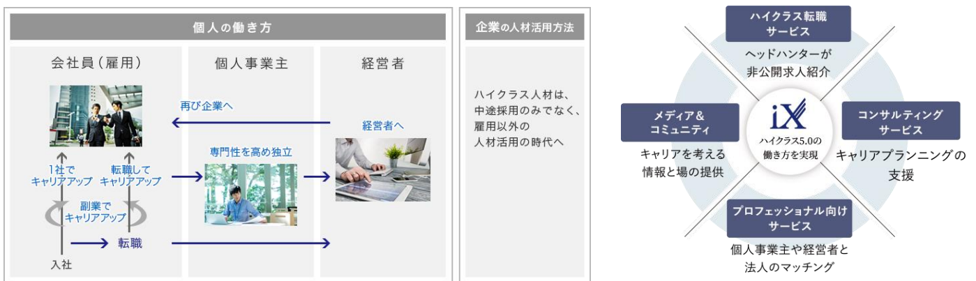
「正解のないハイクラス 5.0 時代」イメージ

「iX」は、このような社会課題の解決に向けて、 キャリアを戦略的に築くことを目指す人のパートナー として、さまざまな「情報」と「選択肢」を提供するサービスです。一つの企業でキャリアを積むだけでなく、転職や副業(複業)、独立、起業などの選択肢が存在する「正解のないハイクラス5.0時代※2」において、 ハイクラス人材やハイクラスを目指す方が高い価値を発揮して通用し続けるための転職サービスをはじめ、4つのサービスを提供してまいります。