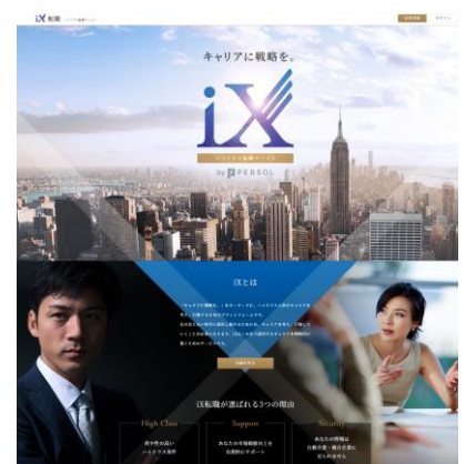
ハイクラス転職サービス サイトイメージ

問い合わせ先 パーソルキャリア株式会社(旧社名: インテリジェンス) 広報部 TEL: 03-6757-4266 FAX: 03-6385-6134 pr@persol.co.jp