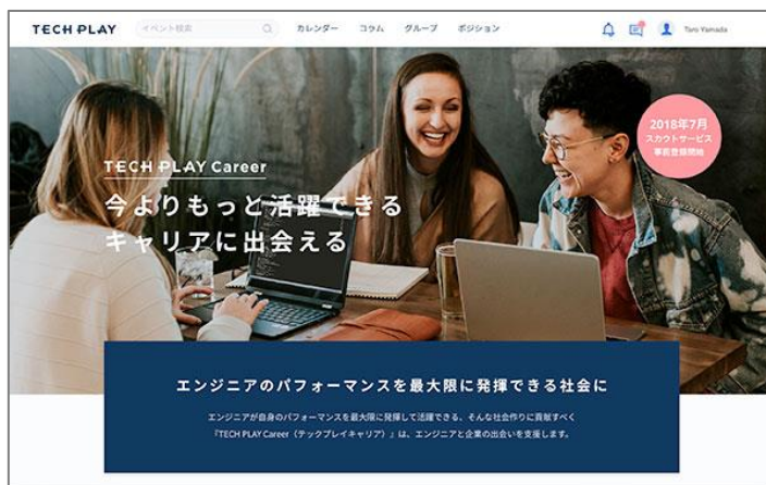
※『TECH PLAY Career』トップページイメージ

エンジニアが活躍できる会社、活躍できる環境を用意しようとしている会社、そしてSNSや勉強会、コミュニティ活動を通じて転職するなど多様化するエンジニアの転職活動を支援することで、エンジニアのキャリアアップを実現できる社会作りにも貢献したいという想いから、『TECH PLAY Career』を立ち上げました。