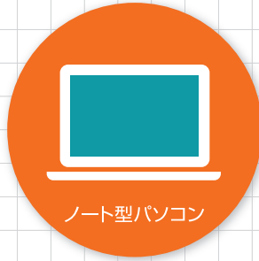
ノート型パソコン