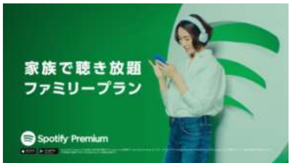
Spotify Premium CM「ファミリープラン」編

世界で1億5,700万人以上のユーザーに利用されている音楽ストリーミングサービス Spotify（会社名 Spotify AB / 本社 Stockholm, Sweden）は、Spotifyの有料プレミアムプランである「Spotify Premium」を紹介する初めてのCMに、音楽好きとして知られ、ご自身もアーティストとして楽曲をリリースしたこともある女優の杏さんを起用いたしました。杏さんが出演する「Spotify Premium」のCMは、4月16日（月）から4月29日（日）まで、関東地区の地上波テレビで放映いたします。